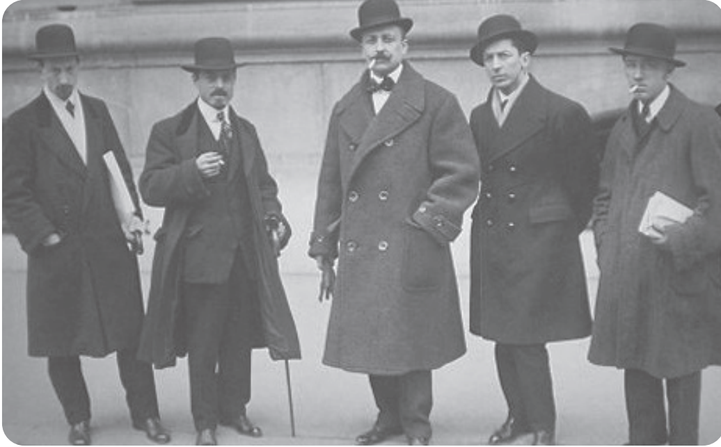
Luigi Russolo • Carlo Carrà • Filippo Tommaso Marinetti • Umberto Boccioni • Gino Severini (Parigi, 1912)

F ilippo Tommaso Marinetti, inventore del Futurismo, rinnovò l'arte e la cultura italiana in tutti i sensi. Perfino la cucina. Per lui l'arrivare a Bologna sembra coincidere con l'alloggiare al Baglioni: "Bologna, Baglioni". La sua firma appare costantemente sui registri dell'albergo che, già allora, era considerato un luogo d'eccellenza. Oggi al Grand Hotel Majestic "gia' Baglioni" si intende non solo ricordare uno dei personaggi più straordinari della storia italiana, ma, dedicando al suo nome il caffè dell'albergo, rendere costante la memoria di un poeta, scrittore, artista, animatore culturale, di cui tutta l'Europa va fiera, come tutti noi.