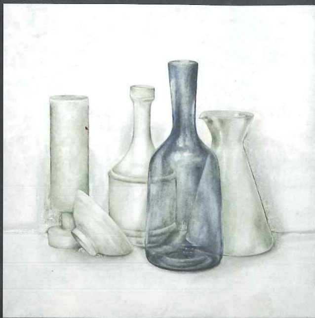
2014 - Natura morta con trasparenza blu olio su tela 50X50