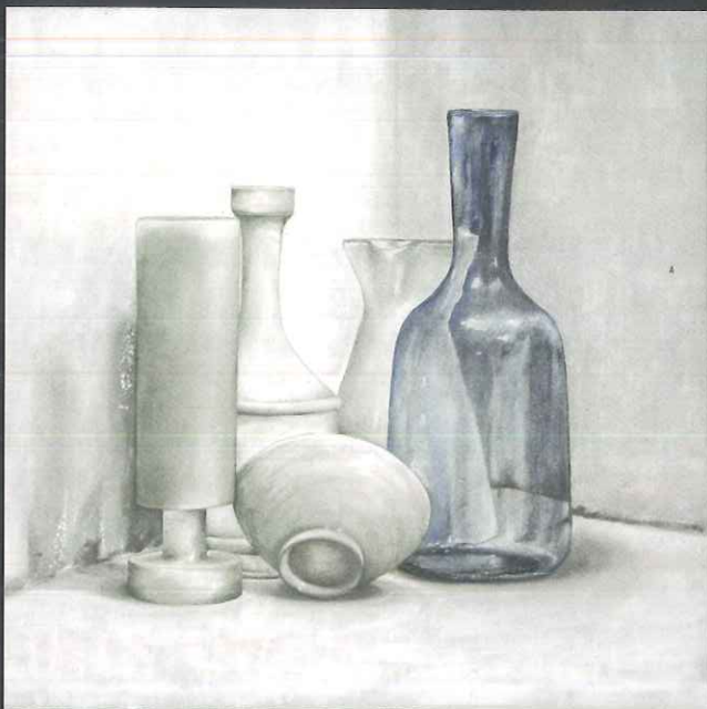
2014 - Natura morta con trasparenza blu 2 olio su tela 50X50

"E cosi' ho dipinto anch'io quegli oggetti che mi sono cari, li ho dipinti con i miei colori e la mia luce, ho cancellato la polvere del tempo per ridare loro quella vita silenziosa propria della natura morta"