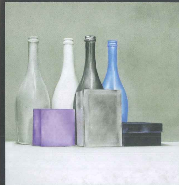
2014 - Composizione numero tre olio su tela 60X60