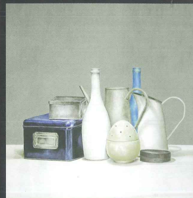
2014 - Composizione numero due olio su tela 60X60