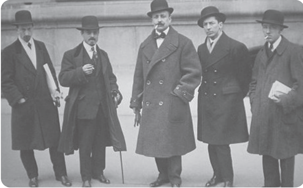
Luigi Russolo • Carlo Carrà • Filippo Tommaso Marinetti • Umberto Boccioni • Gino Severini (Parigi, 1912)

F ilippo Tommaso Marinetti, inventore del Futurismo, rinnovò l'arte e la cultura italiana in tutti i sensi. Perfino la cucina. Per lui l'arrivare a Bologna sembra coincidere con l'alloggiare al Baglioni: "Bologna, Baglioni". La sua firma appare costantemente sui registri dell'albergo che, già allora, era considerato un luogo d'eccellenza. Oggi al Grand Hotel Majestic "gia' Baglioni" si intende non solo ricordare uno dei personaggi più straordinari della storia italiana, ma, dedicando al suo nome il caffè dell'albergo, rendere costante la memoria di un poeta, scrittore, artista, animatore culturale, di cui tutta l'Europa va fiera, come tutti noi.