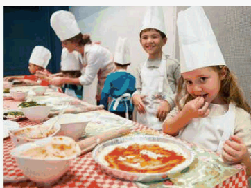
Ogni domenica, laboratorio di pizza all'Hotel Westin Excelsior di Roma.

Qui durante il brunch si impara a fare i biscotti, che una volta pronti si portano a casa. A Pasqua è in programma un laboratorio creativo per dipingere le uova e una caccia al tesoro nel rigoglioso giardino dell'Acanto, il ristorante dell'hotel. Hotel Principe di Savoia, Milano , piazza della Repubblica 17. Adulti 65 euro, gratis i bambini fino a 4 anni, 30 euro dai 5 ai 10 anni. Orari: domenica dalle 12.30 alle 15.00. Per prenotare: tel. 0262305065.