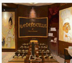
Chocolate room all'Hotel Four Seasons di Milano.

Sandwich al tonno con pane integrale e i lecca-lecca di pancake al mirtillo e banane. Durante il brunch, i piccoli possono dare sfogo alla fantasia imparando ricette