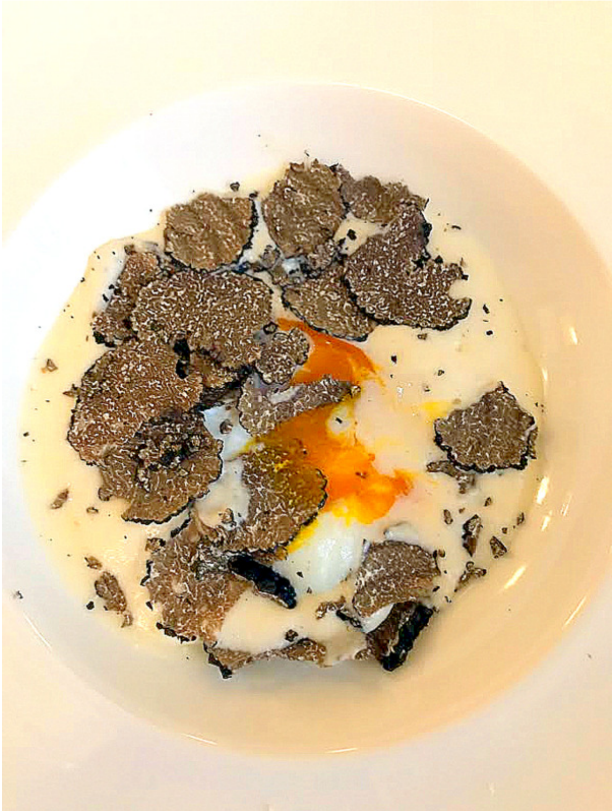
uovo in camicia e tartufo

lunch, scrunch a Bologna. Ma io purtroppo non riesco a rispondere sempre, perché di cose da tener dietro ne ho parecchie. Così ho pensato di giocare d'anticipo, indicandovi un pranzo della domenica carino e maestoso al tempo stesso, perché il pranzo è certamente più nostro del brunch. E poi da qui a Natale, secondo me si cercheranno idee per saluti, chiacchiere, scambio regali, frivolezze e intrattenimenti.