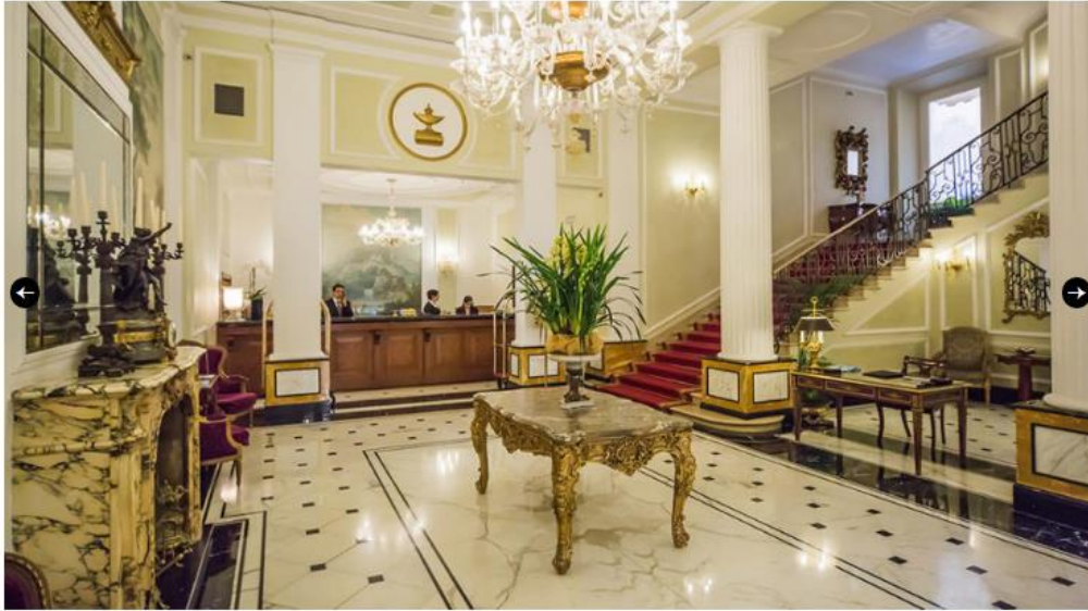
Grand Hotel Majestic "già Baglioni"