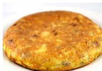
La frittata con il peperoncino