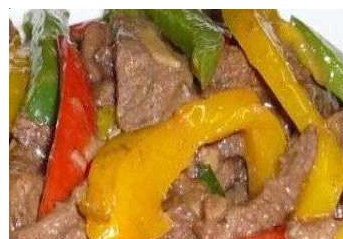
Ricca peperonata con carne