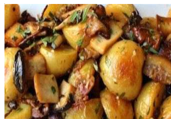
Funghi con patate in teglia