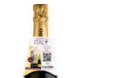
Le guide turistiche di Valdo