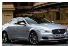
Jaguar Test&Taste Tour 2013