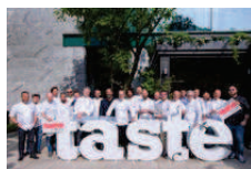
Taste of Milano 2015