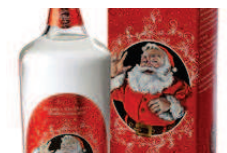
La grappa di Babbo Natale