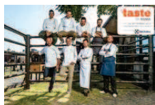
Taste Of Roma 2015