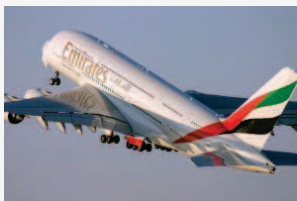
Emirates a Bologna, hotel si adeguano a clienti musulmani

BOLOGNA – Menù studiato per il Ramadan, niente maiale o alcol, tappetino in stanza e bussola per cercare la giusta direzione per La Mecca . Gli hotel di Bologna, come già ha fatto il Grand Hotel Majestic, si stanno adeguando a un nuovo tipo di clientela: i tanti musulmani che dovrebbero arrivare in città grazie alla nuova rotta Emirates che collega Bologna e Dubai .