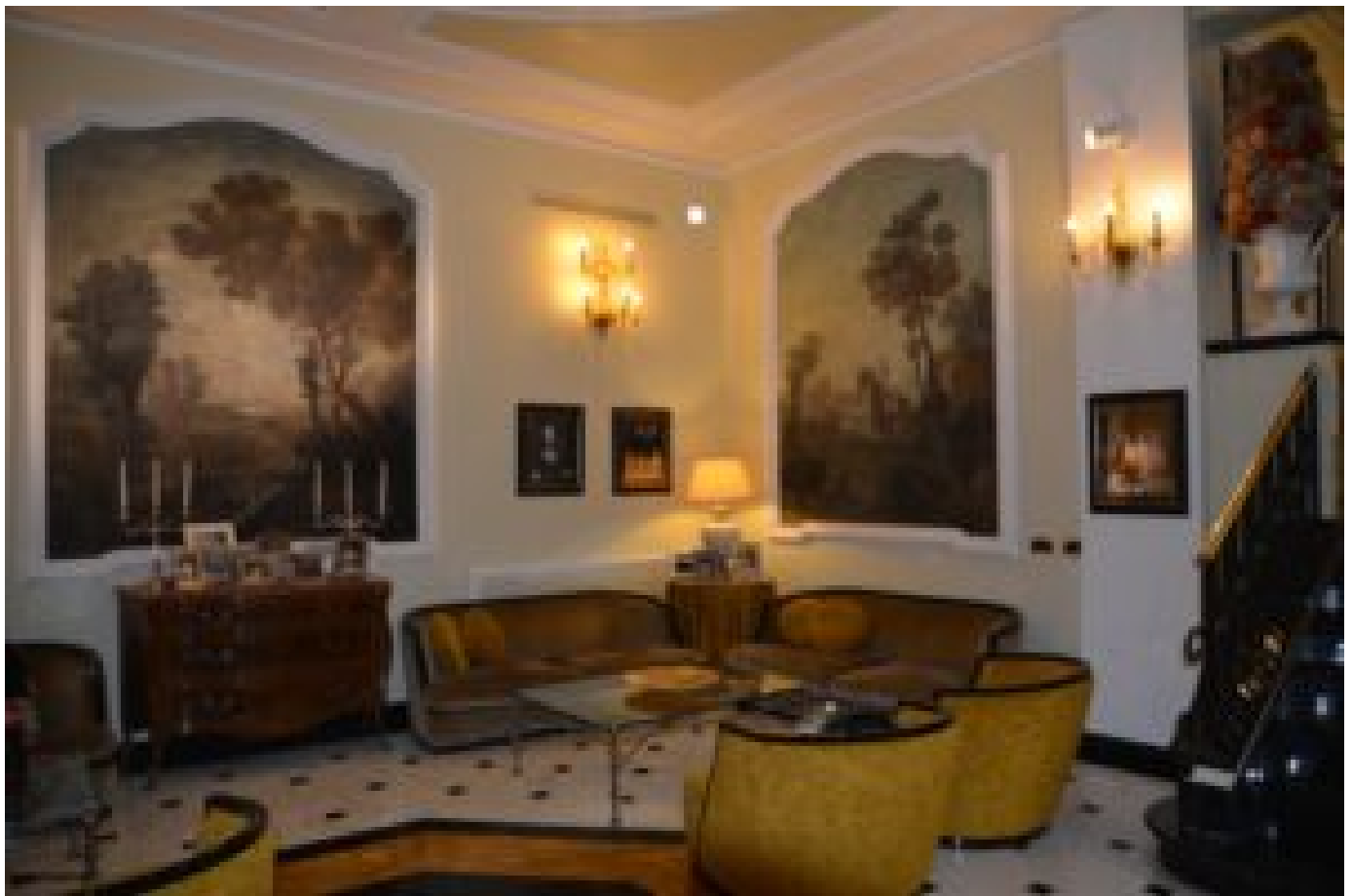
Bologna: Grand Hotel Majestic har fotografert alle kjendisene som har overnattet på hotellet. Bildene henger både på veggene omkring og på kommodene i denne loungen.