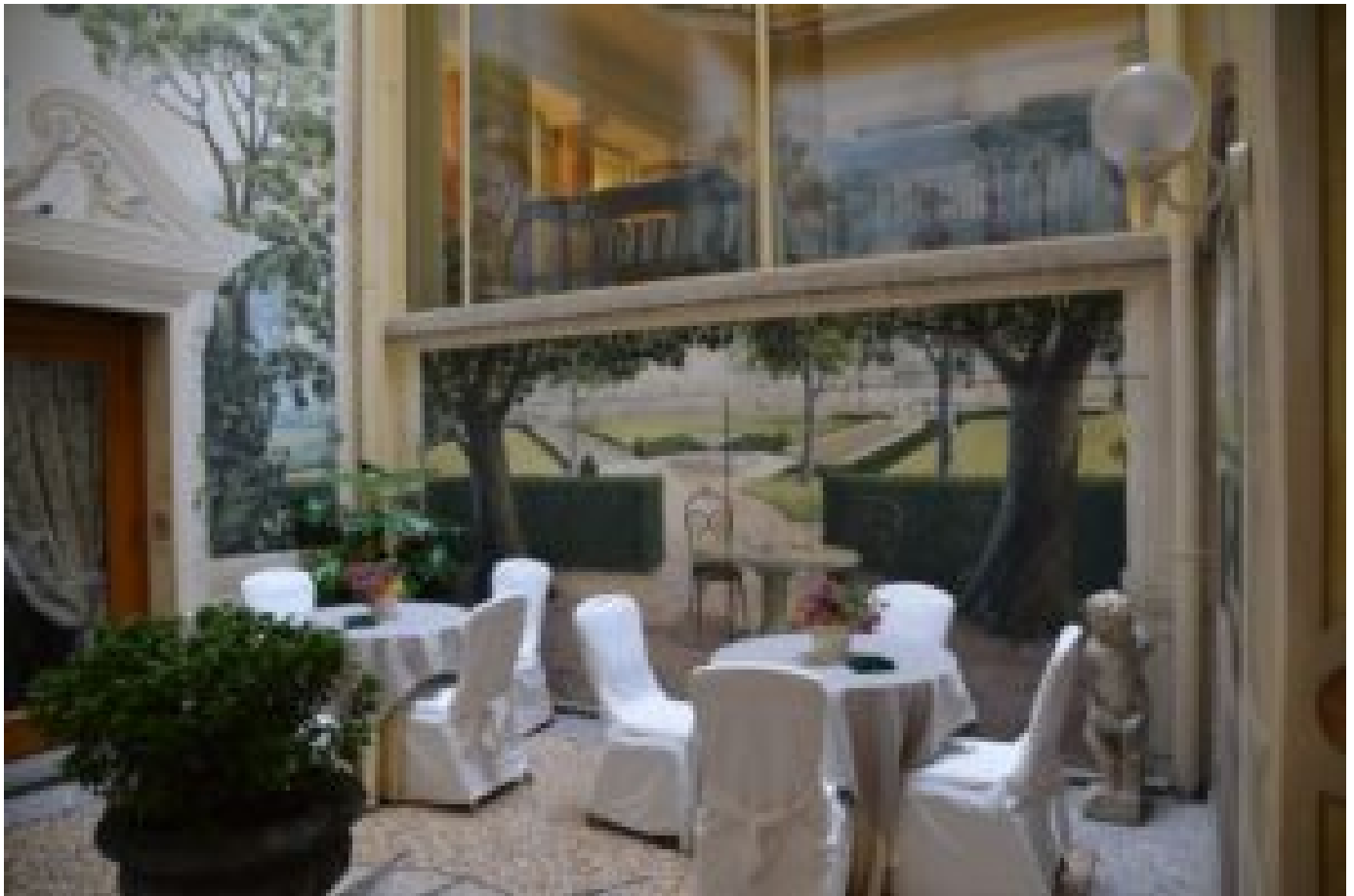
Bologna: Koselig uteområde under frokostbuefen.