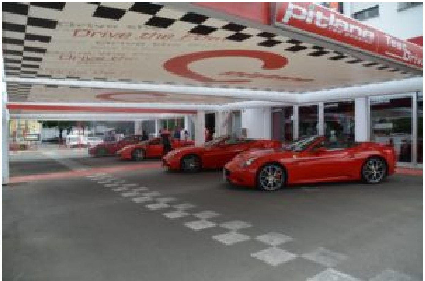
Utenfor Bologna i Maranello finner du Ferrarifabrikken. Her står bilene klare til testkjøring.