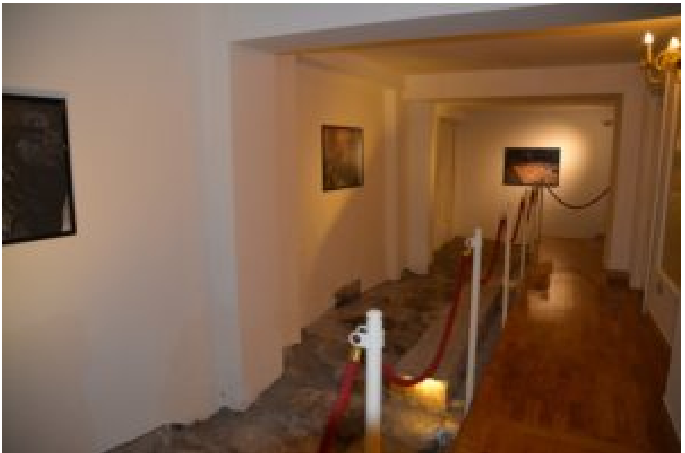
Bologna: Hotellets kjeller huser en arkeologisk hemmelighet – en romersk vei.