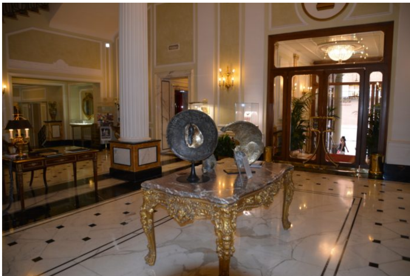
Bologna: Inngangen til Grand Hotel Majestic Hotel.